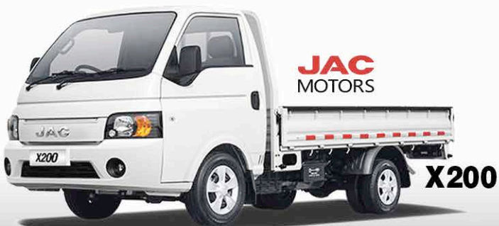
JAC MOTORS X200