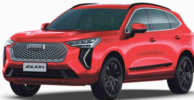
HAVAL by GWM JOLION