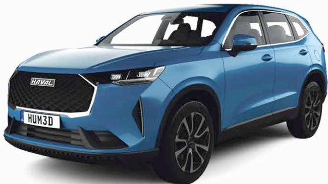
HAVAL H6 3ème GÉNÉRATION

sur tous nos modèles Jolion, H6, X200 & Tank 300